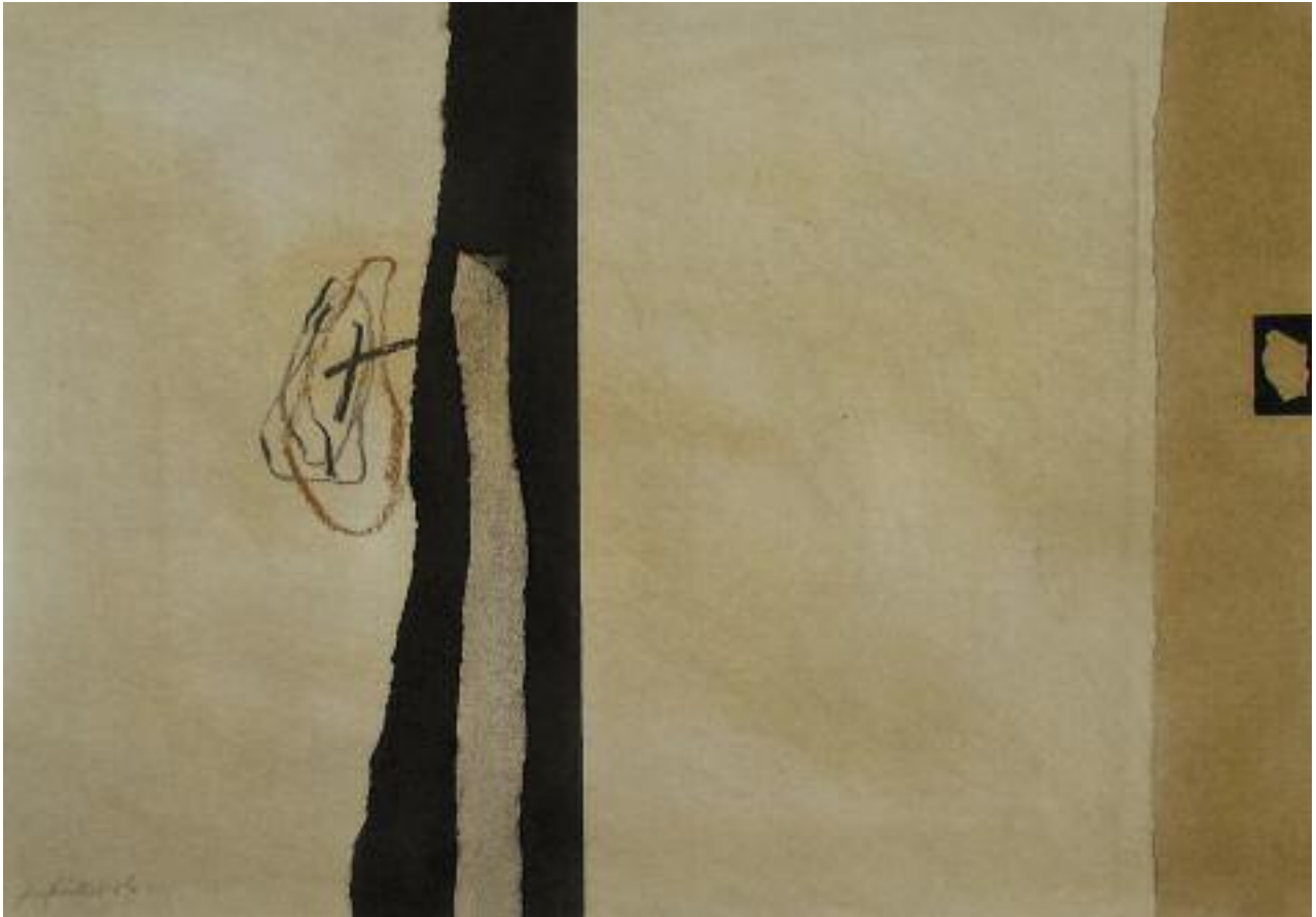
Ohne Titel 91-8/09 Mischtechnik auf Papier 28,5 x 40,5 cm 2009