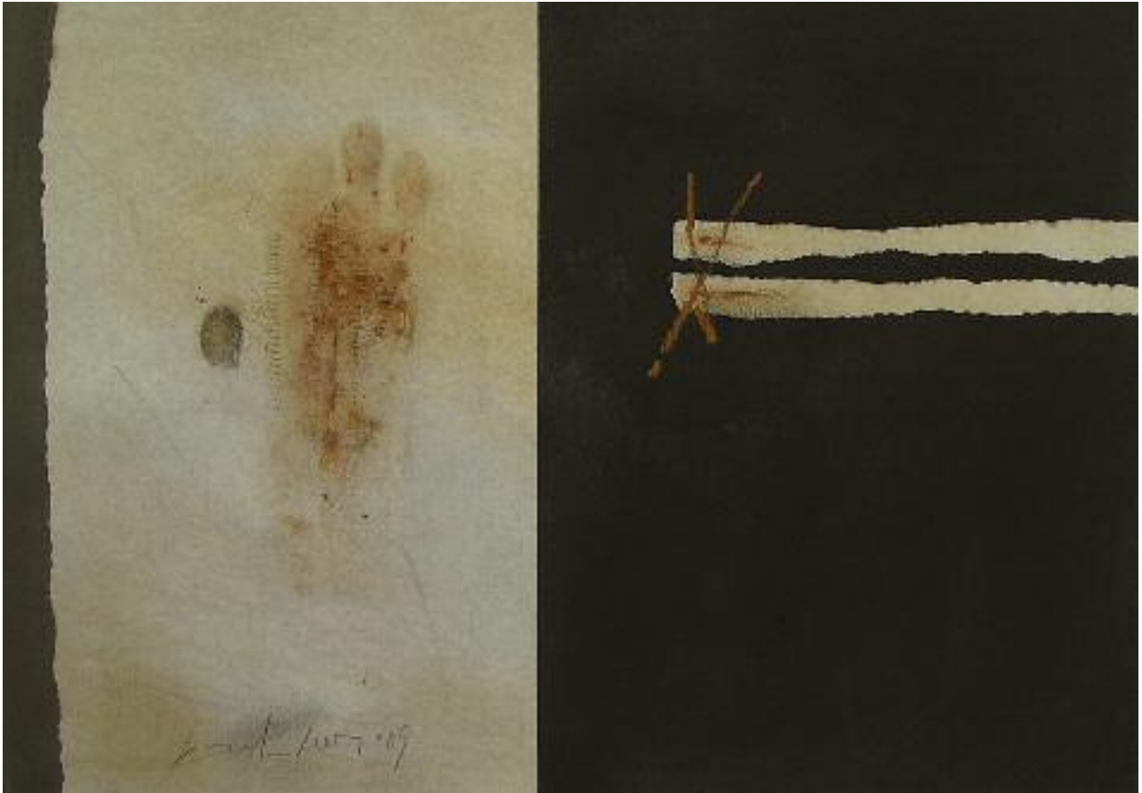
Ohne Titel 90-8/09 Mischtechnik auf Papier 28,5 x 40,5 cm 2009