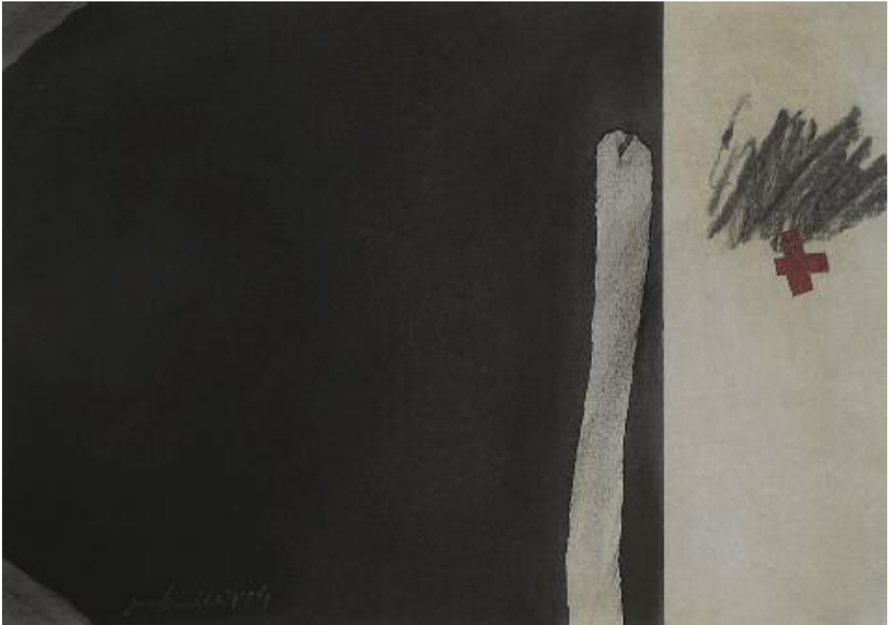
Ohne Titel 92-8/09 Mischtechnik auf Papier 28,5 x 40,5 cm 2009